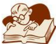
TABLE DES MATIERES